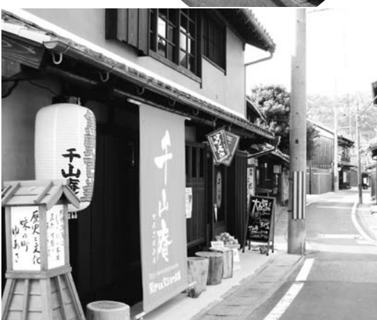
地域住民の意向がこらされている手作り観光地・湯浅。町並みを歩くとその工夫に驚かされる。