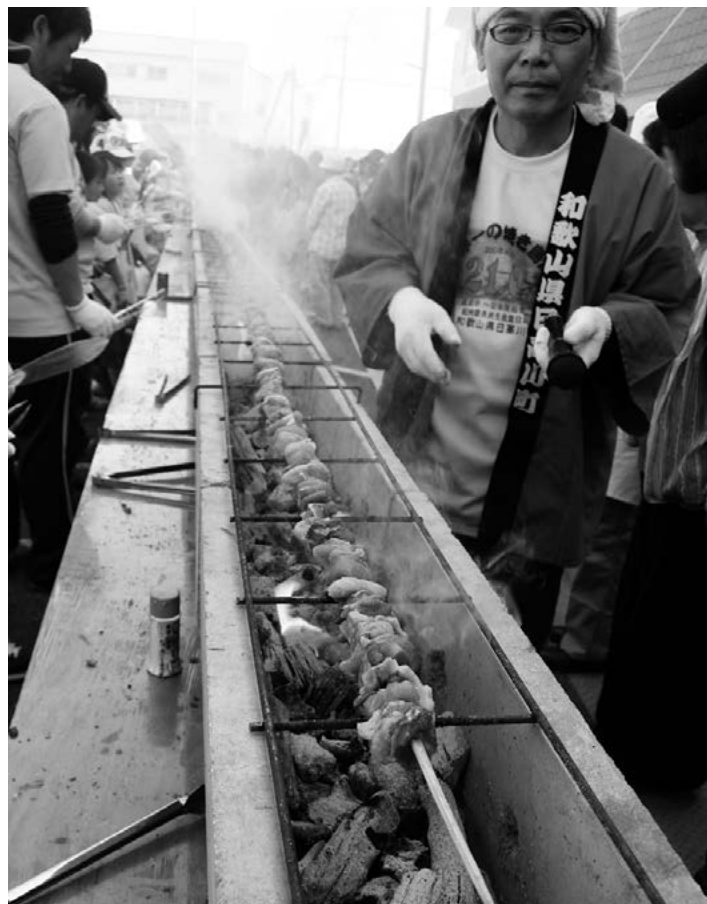
今年4月、大勢の観客と取材が見守るなか、一本の竹に串刺しをしたホロホロ鳥が焼き上がった。全国やきとり連絡協議会の審判員が21mと判定、見事焼き鳥の長さ世界新記録を樹立!