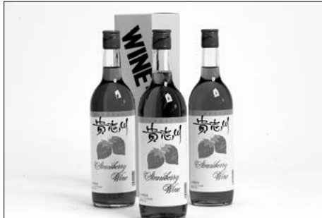
■いちごワイン 1本 720ml 1,365円(税込) スッキリとした甘い香り、あつさりして美味しいです。お酒は20歳になってから。

お取り寄せ・お問い合わせ先 貴志川観光物産センター 〒640-0411 和歌山県紀の川市貴志川町前田135-1 TEL.0736-64-8787 FAX.0736-64-4748