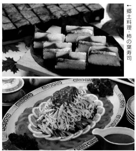
「柿の葉寿司」柿酢を調味料として使用する。写真上は柿の葉寿司の酢飯に柿酢を使用している。写真下は、パンフレットのイラストに柿酢を使用している。

「うちの柿酢はほんとうにまろやかで、味に癖がなく、いろいろなお料理にお使いいただけます。たとえば、野菜と漬けてピクルスや酢の物、このあたりの郷土料理として知られている柿の葉寿司の酢飯や酢豚の調味料など、和・洋・中華なんでもすっきりと料理に合いますよ。ほかにも青梅や山桃、イ