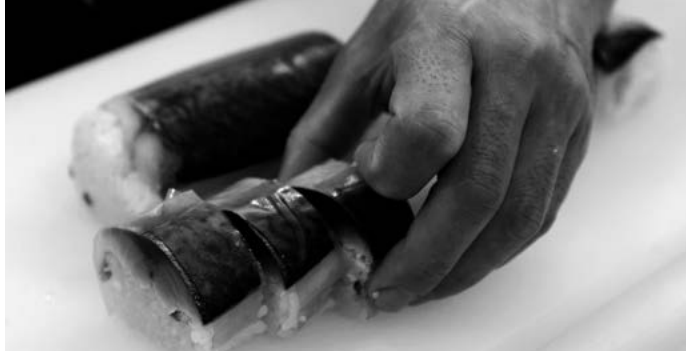
一切れずつ心を込めて切り分けていく。

「サバの棒寿司はさきほど実際に召しあがっていかがでしたか。意外とさっぱりしてて、しょう。ありがとうございます。そうなんです。その点についてが、いちばん苦心致しました。サバには旨みもあるけど、独特の臭みもある。とくに青魚特有の臭みが苦手だと仰るお客さまもいらっしゃいますので、臭みをおさながらサバ本来の旨みはしっかりと残す。そのためにシャリのなかにペースト状態にした梅干しを少し混ぜ込んでみたり、大葉を刻んで入れてみたり、いろいろ試みてみたりです。で、最終的にこれと辿りついたのが有田