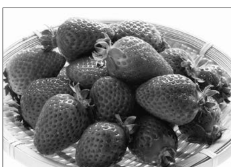
■イチゴ 1パック 300円より(税込) あまくておいしい朝採りイチゴ(販売期間/12月～5月中旬)