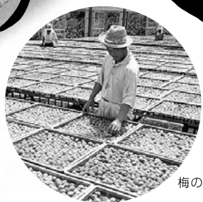
梅の実の干し風景