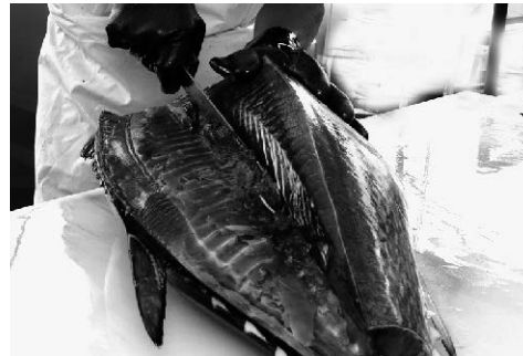
水揚げ後すぐに解体して 鮮度を保ったままお届けします