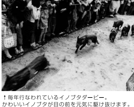
↑毎年行なわれているイノブタデー。 かわいいイノブタが目の前を元気に駆け抜けます。