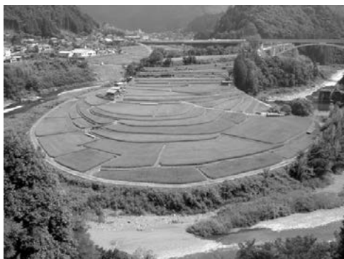
扇形に広がる美しい棚田の「あらぎ島」