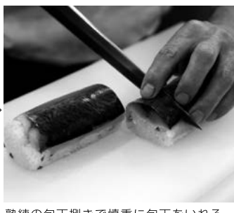
熟練の包丁捌きで慎重に包丁をいれる。